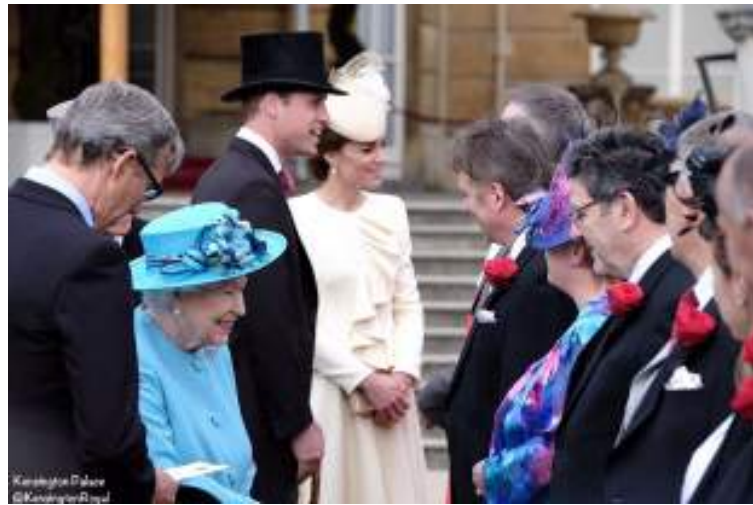
La Reina Isabel II y los Duques de Cambridge en los jardines con los invitados