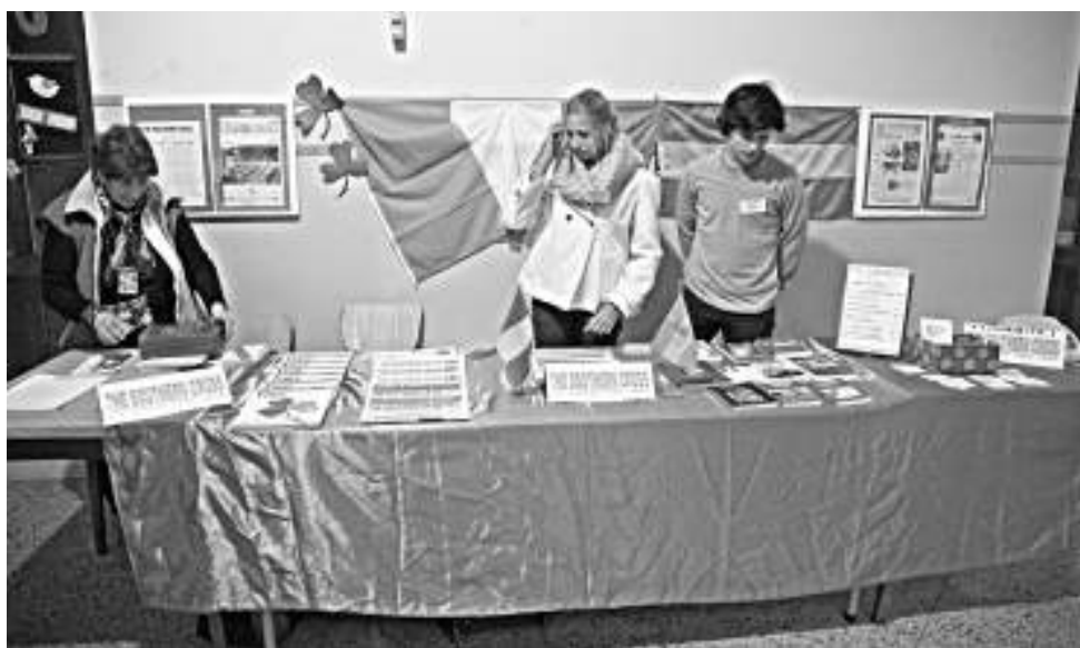
El stand de The Southern Cross