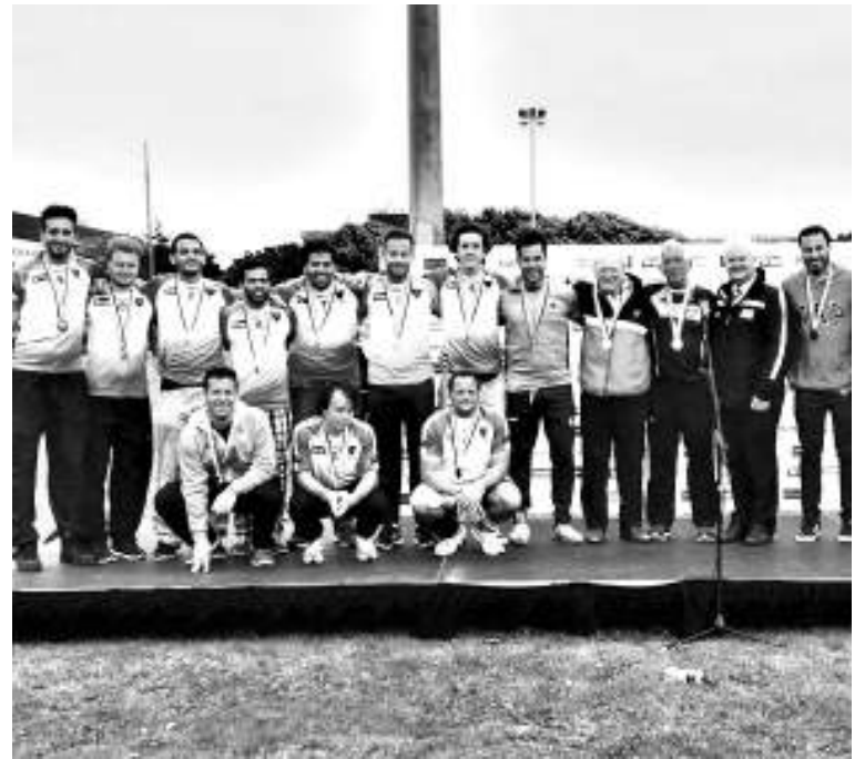
El equipo completo del Hurling Club representando a la Argentina