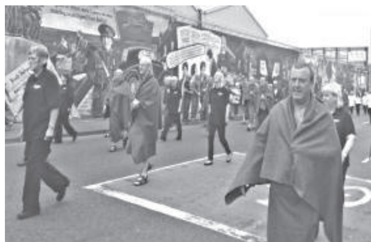
14 de agosto de 2016, manifestantes con mantas en recuerdo de los huelguistas.

partido del Ulster con la mayoría de los votos y convirtiéndose en el miembro más joven del parlamento y en condición de preso. Rápidamente el gobierno británico decretó el Acta de Representación Popular que consiste en que presos con condena en cumplimiento no pueden participar de las elecciones. Unas pocas semanas después a la edad de 27 años, Bobby Sands muere después de 66 días de huelga de hambre.