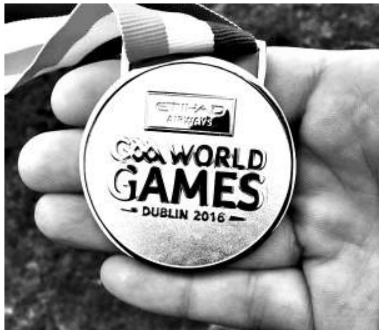
La medalla de la GAA por haber participado en el Mundial

acceso a estos deportes alternativos para la institución de Hurlingham que cumplió 94 años en agosto.