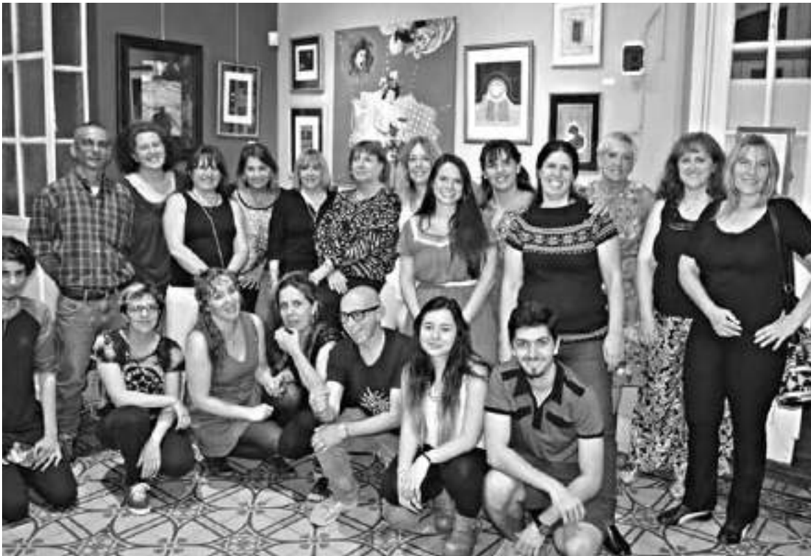
Los participantes de la muestra Irlanda junto a Torres Barthe

Directora de la Galería Torres Barthe, durante el mes de julio coordinó una exposición de obras de arte emergente sobre Irlanda en conjunto con las fotografías de Suipacha realizadas por Matías Failo Byrne que ya habían sido expuestas en la Biblioteca Nacional, en el marco del centenario de su independencia y del bicentenario de la independencia Argentina. En esta entrevista, nos cuenta cómo llegó a organizar la muestra, la importancia de no caer en los clichés comerciales que tiene el imaginario irish, su vínculo con los Barthe, y la segunda muestra que están preparando para octubre.