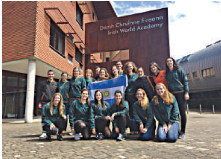
En la Academia Mundial de Irlanda, Limerick

"Si puedes soñarlo, puedes lograrlo". Esta frase se puede leer en la remerita de los Integrantes de Celtic Argentina, debajo de su escudo y