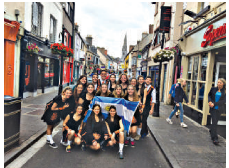
En el párrafo Ennis Irlanda Art Festival de la Calle

Comhaltas, nuestro mentor y profesor muy querido por todos nosotros que desde hace años acompaña el desarrollo de nuestra Escuela y, también, tuvimos nuestra primer clase de Sean Nos, el estilo antiguo del step dancing irlandés. Además, disfrutamos de Riverdance The Show, nada menos que en el Gaiety Theatre.