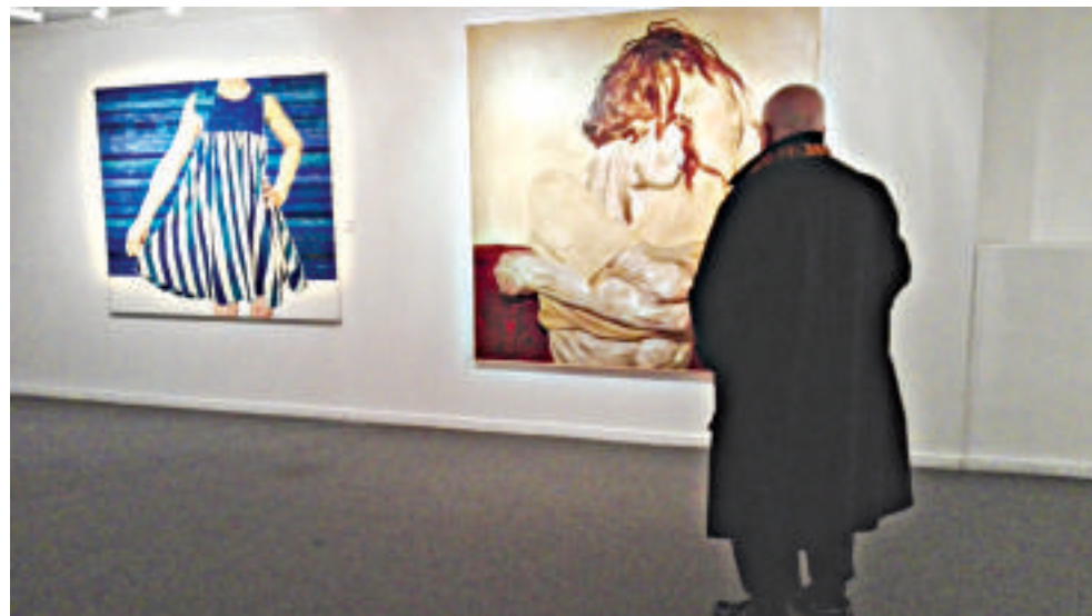
El público contemplando las obras artísticas

Ortega y Gasset (FOGA) organizó esta muestra para conmemorar el Levantamiento de Pascua de 1916 en Irlanda, lo que es más que oportuno ya que también nos permite poner en relieve como argentinos descendientes de irlandeses, la concurrencia entre el