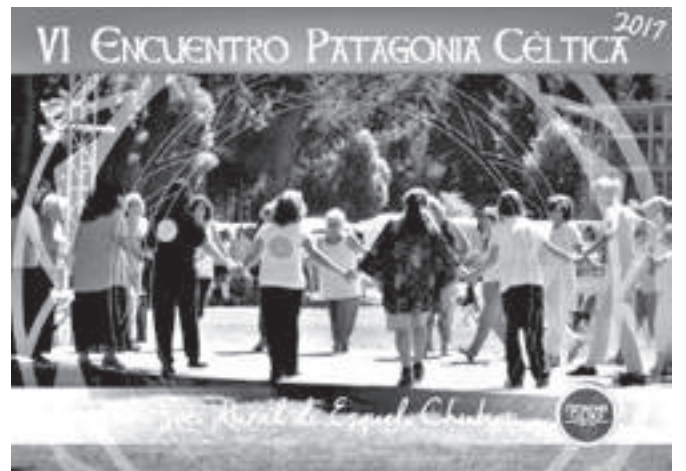
Patagonia Céltica 2017.

Durante el jueves 2 de marzo, los artistas extranjeros recorrerán la Ruta de los Galeses que une Puerto Madryn con Trevelin, reviviendo la histórica travesía que hicieron los pioneros, acompañados por los integrantes de los grupos de danzas de Puerto Madryn y Trelew y guiados para que comprendan el contexto en el cual se hicieron los primeros viajes a finales del siglo pasado. Se harán paradas para fotografiar lugares de interés como Las Plumas, Los Altares, Rocky Trip y otros.