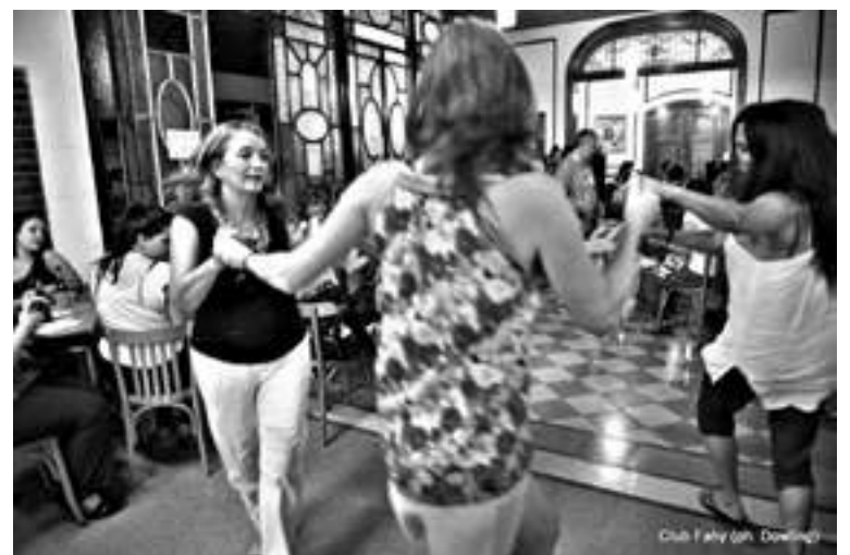
Club Fahy

Desde 1979... renovando el compromiso y la trayectoria