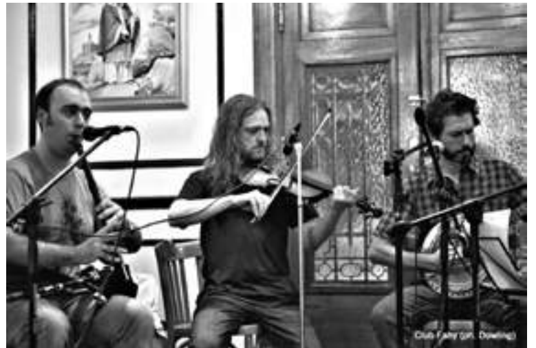
Club Fahy