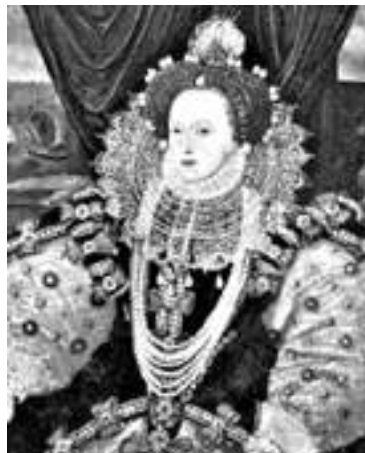
Queen Elizabeth I