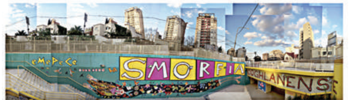
La intervención de Fallon en el barrio porteño de Coghlan

el hombre empezaba a ser hombre... Y pintaba... y en las paredes!! Más para acá, los frescos italianos del renacimiento, los vitrales de las iglesias góticas, el esgrafiado de las columnas y frisos romanos. Casi que pensado así, lo raro o poco habitual es el cuadro u otros soportes móviles.