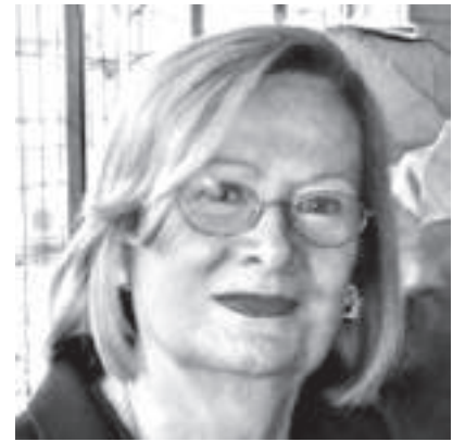
Gentileza Oscar Stern

Tere nació un 16 de febrero, y Dios quiso que tenga un último cumpleaños antes de partir el pasado 17 de febrero.