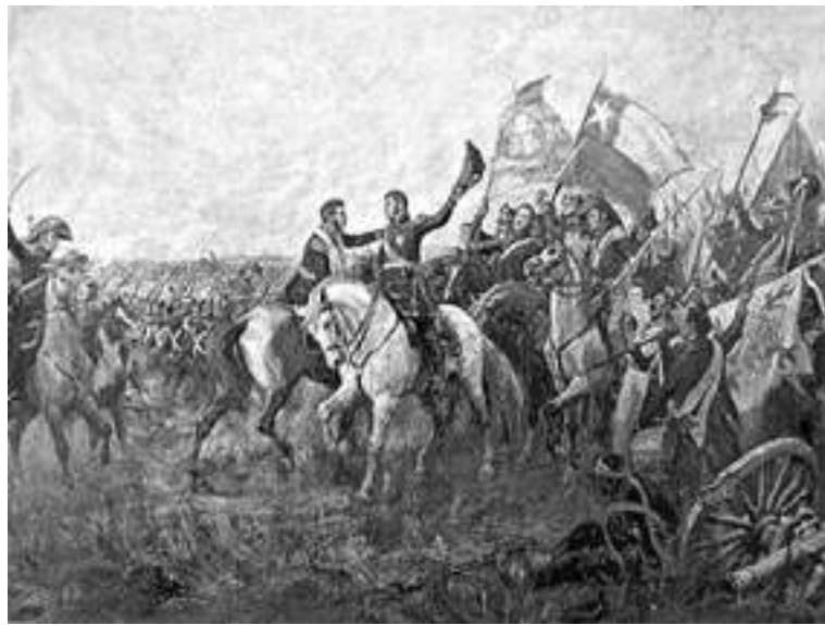
Los grals. O'Higgins y San Martín en Maipú (pintura “el abrazo de Maipú” de P. Subercaseaux)

John Thomond O'Brien tenía 26 años cuando llega al Río de la Plata desde el pequeño pueblo de Baltinglass en el condado irlandés de Wicklow. Luego de unos meses de incursionar en el comercio decidió ingresar al Regimiento de Granaderos a Caballo, al mando del entonces teniente coronel José de San Martín. Allí se entabla una “una amistad permanente” entre jefe y subordinado. Participó de sitio de Montevideo y recibe su primera medalla como reconocimiento a su