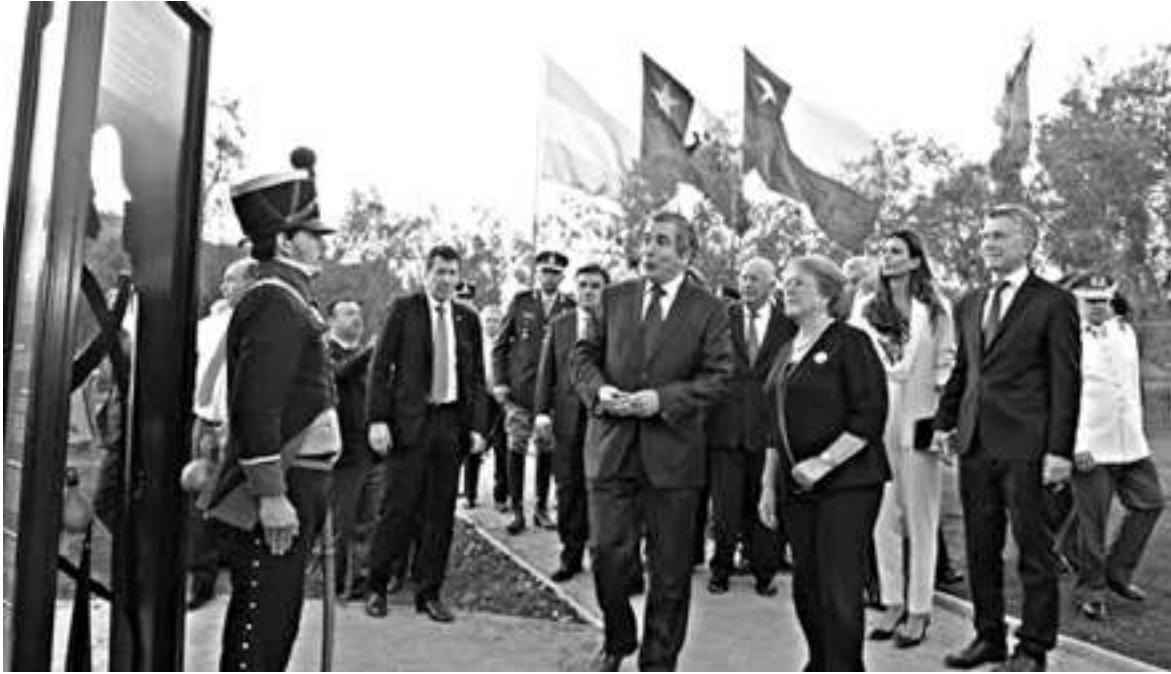
Los Presidentes Bachelet y Macri en el acto central

Los actos centrales recordatorios del bicentenario de la batalla de Chacabuco tuvieron lugar el 12 de febrero ppdo. en el mismo campo de batalla, con la presencia de los primeros mandatarios de Chile y Argentina, Michelle Bachelet y Mauricio Macri, así como altas autoridades de ambos países.