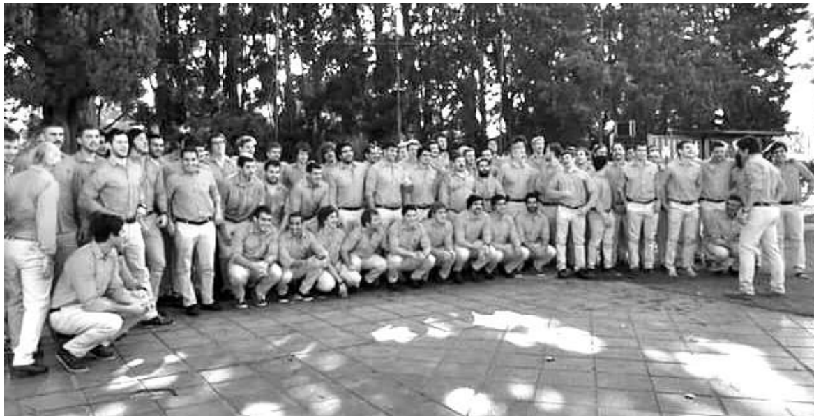
El plantel de rugby antes de partir rumbo a Ezeiza.

El martes 21 de febrero el plantel superior de rugby partió rumbo a Irlanda en el marco de la Gira de Rugby que se llevará a cabo en aquel país y en Inglaterra. En Dublin el equipo sostendrá un partido amistoso con Trinity College. Antes de partir, se llevó a cabo una misa en el club para bendecir la gira, con la presencia del plantel completo y sus familias.