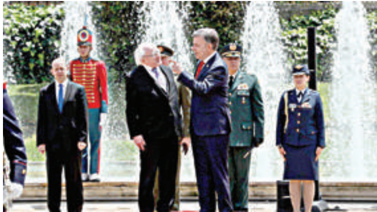
Los Presidentes Higgins y Santos, en Bogotá, Colombia

En una charla titulada 'De un pasado de conflicto hasta un futuro de paz', que se llevó a cabo en la Universidad Nacional de Colombia, Higgins habló de la experiencia de Irlanda en el proceso con el Ejército Republicano Irlandés (IRA). Y aseguró que el proceso de paz colombiano es innovador y un ejemplo para el mundo y que necesita el apoyo internacional. Higgins resaltó temas del acuerdo entre el gobierno y las FARC como los puntos en común con las víctimas,