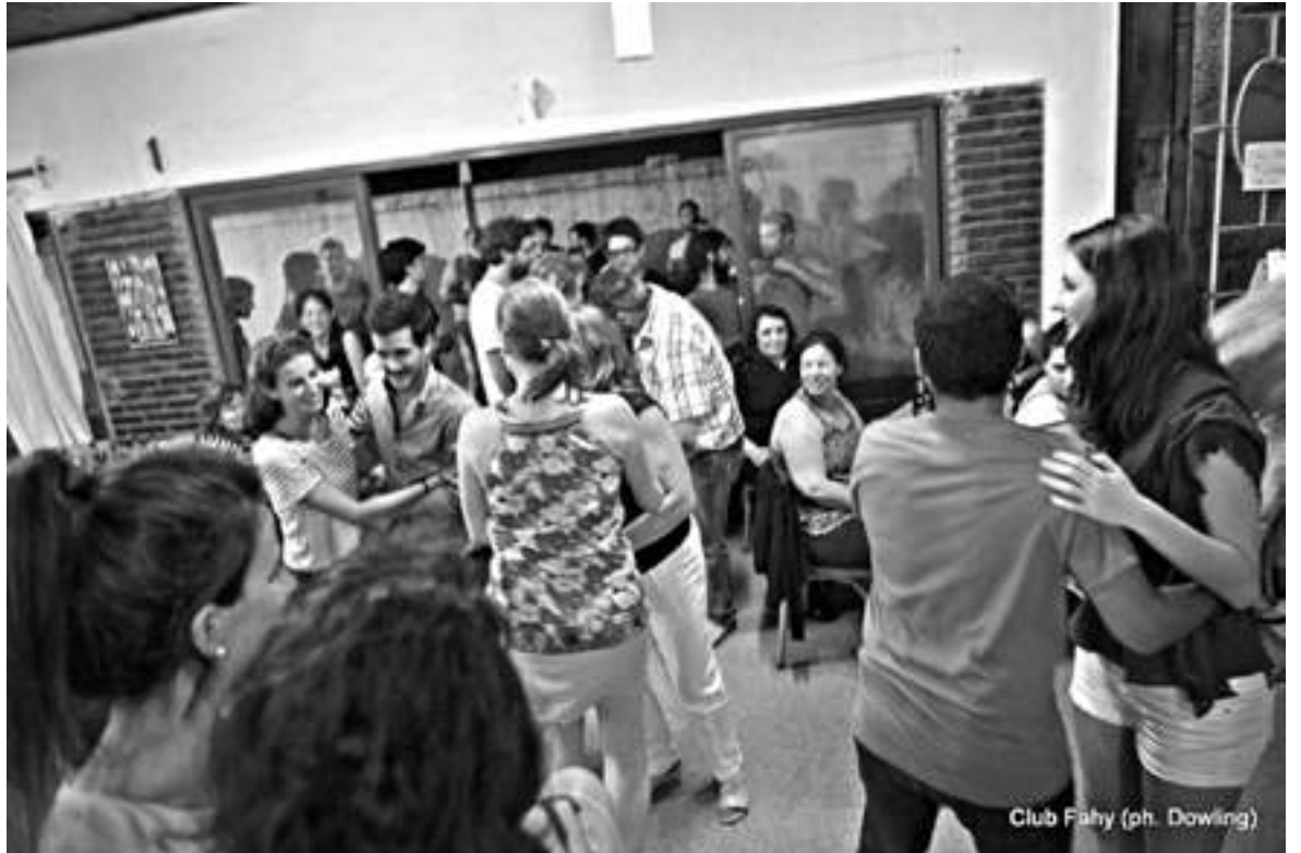
Club Fahy

Y ya prometen una nueva Irish Night en el mes de San Patricio, para el 11 de marzo.