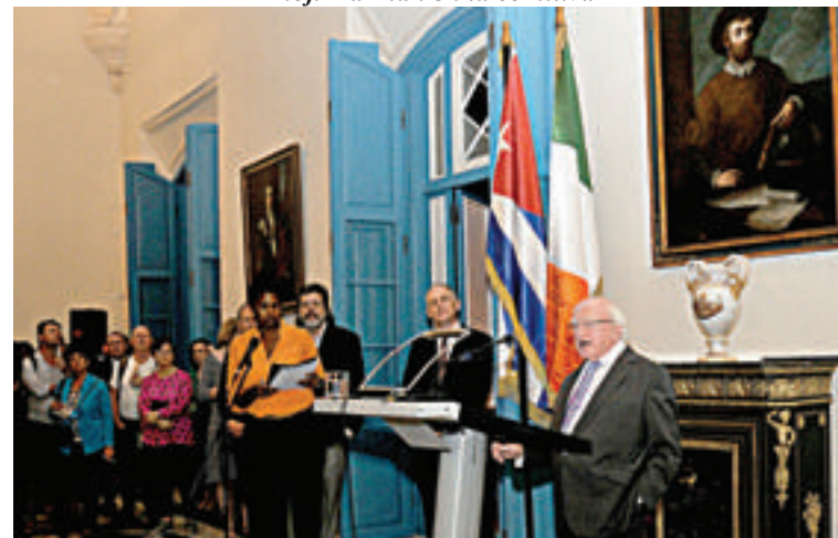
El Presidente Higgins en La Habana, Cuba