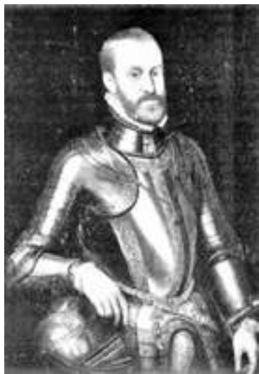
Capt. Francisco de Cuellar

a policy of piracy against Spanish trade and began to plunder the great Spanish treasure ships returning from the New World. When the Treaty of Nonsuch was signed at Nonsuch Palace in Surrey by Elizabeth in 1585, and which promised troops and supplies to the Dutch rebels, sworn enemies of Spain, Philip considered this an act of war and initiated plans for an invasion of England. The last straw for Philip was the execution of Mary, Queen of Scots, in 1587, which ended Philip's hopes of placing a Catholic on the English throne. He turned instead to more direct plans to invade England and return the country to Catholicism.