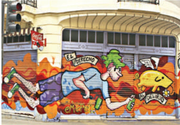
Intervención urbana llamada “El derecho al delirio”

Como punto inicial, es interesante relevar ese proceso y ver los cambios. Y muchas veces hay que estar preparado para las sorpresas: en mi barrio pinté algunos chanchos voladores allí donde no estaban correctamente señalizadas las paradas de colectivo, con los números de las líneas y los colores de los coches; posteriormente, los recorridos fueron modificados, pero algunas pintadas siguen aún allí. Me pasó también de pintar a los Chanchi-