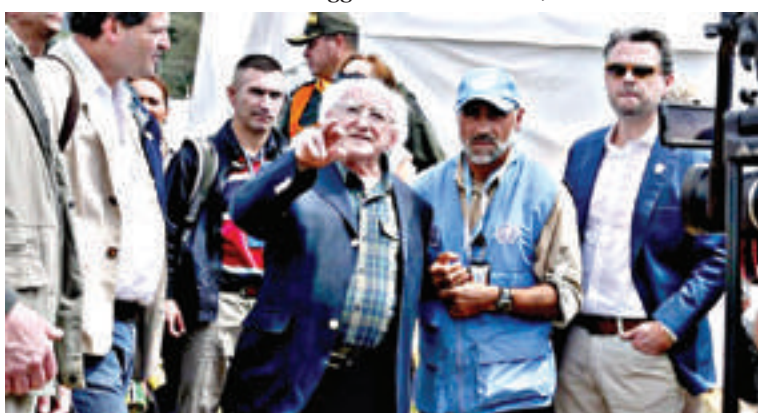
Visita al campamento de las FARC, en Colombia

la igualdad de género y lo relacionado con etnias indígenas y afros.