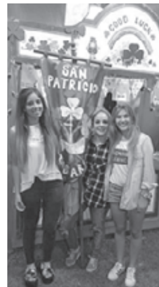
Las jóvenes irlandesas rosarinas presentes