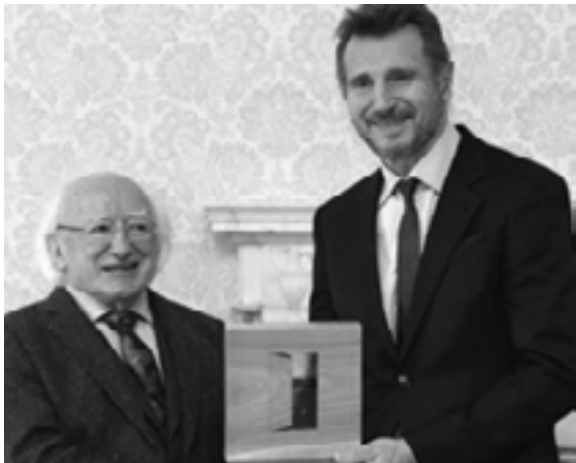
President Michael D Higgins awards the last of the 2017 Presidential Distinguished Service Awards to actor Liam Neeson