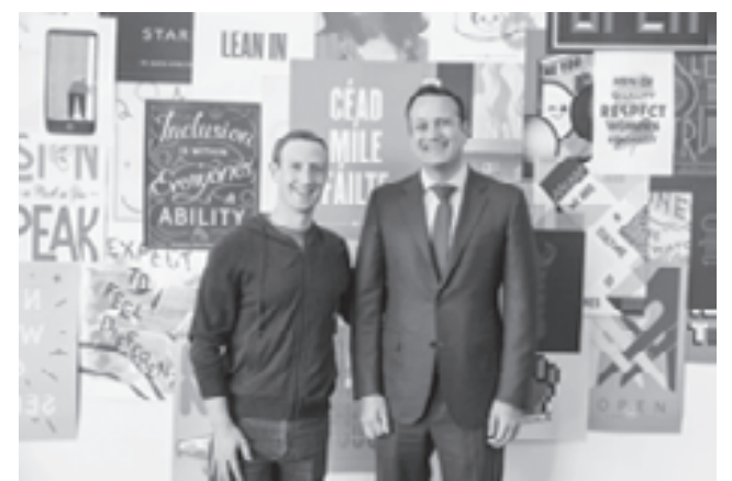
Junto al CEO y fundador de Facebook Mark Zuckerberg.

Al final de la gira cuando le preguntaron a Varadkar sobre la cuestión de los impuestos, afirmó: "Lo que siempre decimos sobre nuestra tasa impositiva es que es constante,