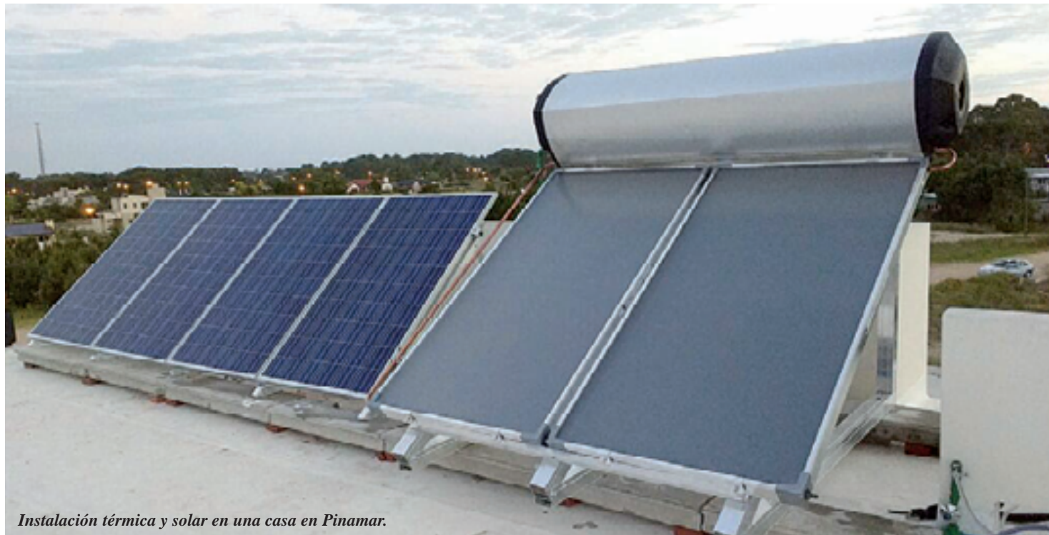
Instalación térmica y solar en una casa en Pinamar.

Uruguay, Chile y Brasil tienen legislación. Regionalmente hay señales de que esto es necesario desde el punto de vista legislativo. En Argentina creo que esta vez se está tomando el tema en serio y esperamos que en los próximos años las gestiones que vengán continúen con este rumbo. En el