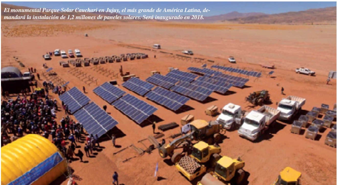
El monumental Parque Solar Cauchari en Jujuy, el más grande de América Latina, demandará la instalación de 1,2 millones de paneles solares. Será inaugurado en 2018.