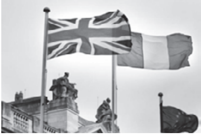
La frontera abierta es crucial para la paz en Irlanda del Norte. Dublín podría tomar una última oportunidad para detener Brexit. Irlanda del Norte sin un gobierno provincial.

“Nunca vas a vencer a los irlandeses” es la canción que a los fanáticos les gusta cantar en los encuentros deportivos internacionales que involucran a la República de Irlanda. A veces termina siendo irónico, pero el espíritu alegre de los fanáticos es resistente. Sin embargo, el Brexit amenaza con vencer a los irlandeses de varias maneras, ya que Irlanda del Norte deja la UE y los llamados seis condados en el norte de la isla de Irlanda se convierten en territorio extranjero.