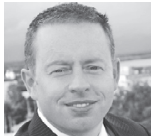
Minister Ciarán Cannon

Mr Cannon is also examining ways of making it easier for emigrants returning home. That includes the possibility of providing "a unique grant" for returning Irish citizens or their children to study in Irish universities and colleges so they don't have to pay considerably higher EU or international fees.