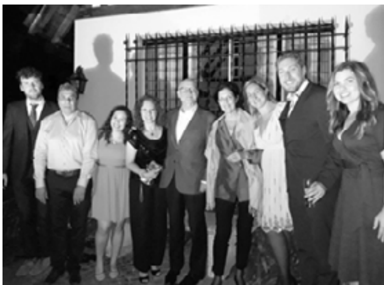
Todo el Staff de la Embajada