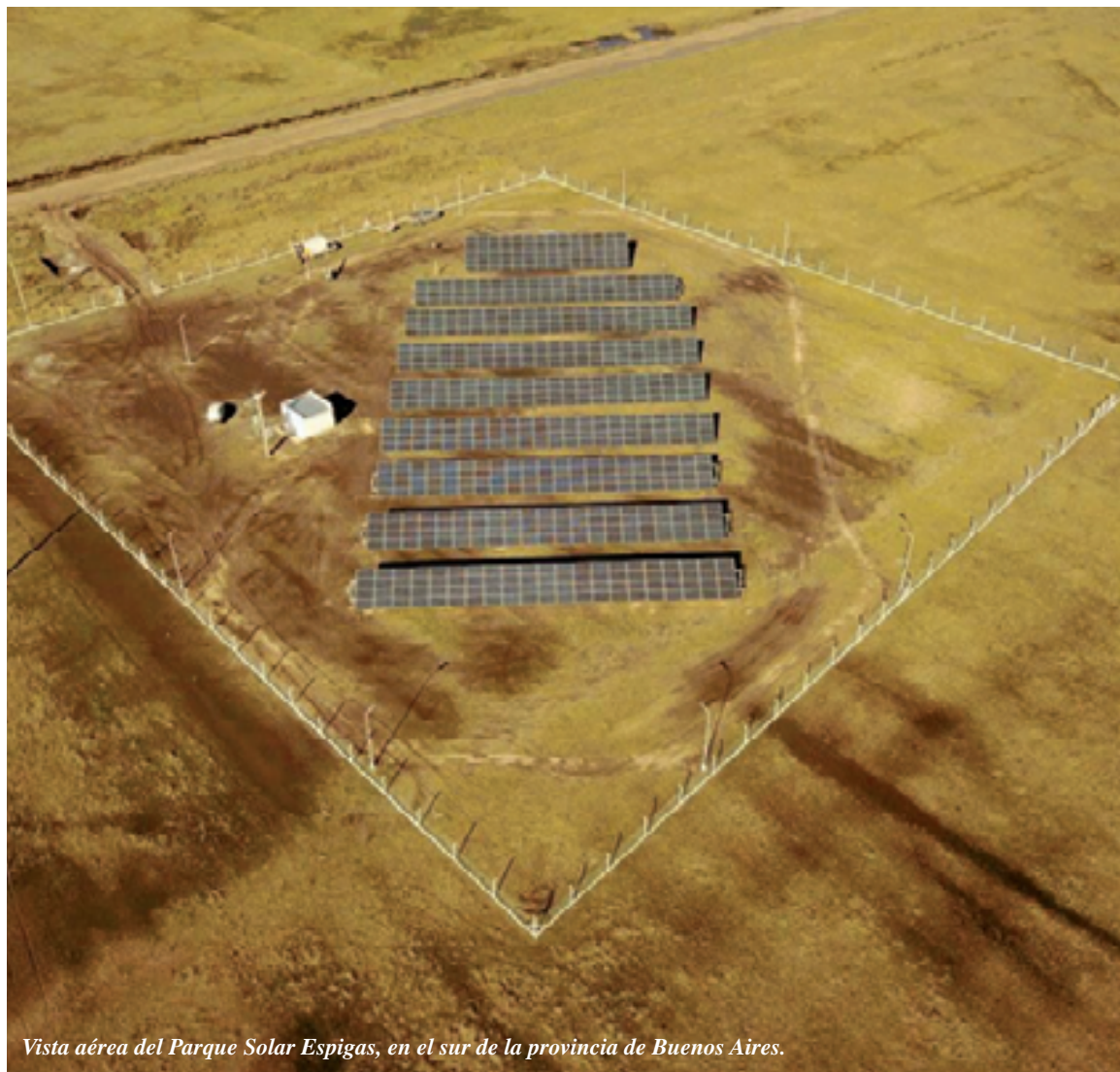
Vista aérea del Parque Solar Espigas, en el sur de la provincia de Buenos Aires.

En La Plata, hoy funciona en el Centro Cultural Malvinas Argentinas, el primer cine que se abastece íntegramente de paneles solares. El centro cultural está rodeado por un predio verde, sobre la calle 50 llegando se pueden ver en el cielo como se asoman dos finos y altos ventiladores.