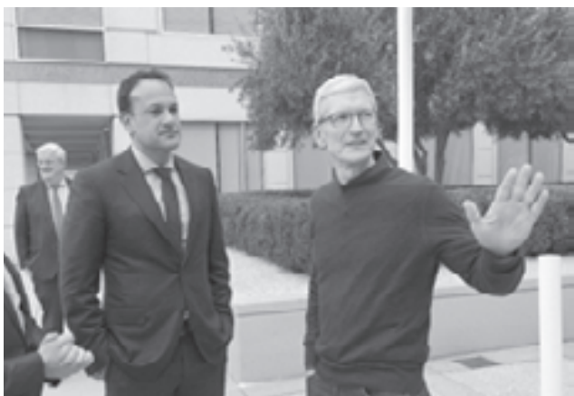
En Apple junto a su CEO Tim Cook.

Irlanda se pone impaciente con Apple. Tras la presión judicial de la UE a Irlanda por los impuestos "perdonados" a Apple que ascienden a unos 13.000 millones de euros, el primer ministro irlandés dice que "Hemos dicho a Apple que queremos el depósito establecido y los fondos pagados sin más dilación". Un posible encononazo judicial entre Irlanda y Apple podría causar problemas serios para ambas partes.