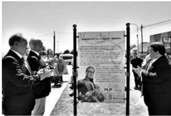
Nedela y Harman ante la información sobre el fundador de la Armada Argentina