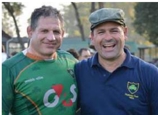
Con uno de los jugadores de la primera del plantel de rugby del HC