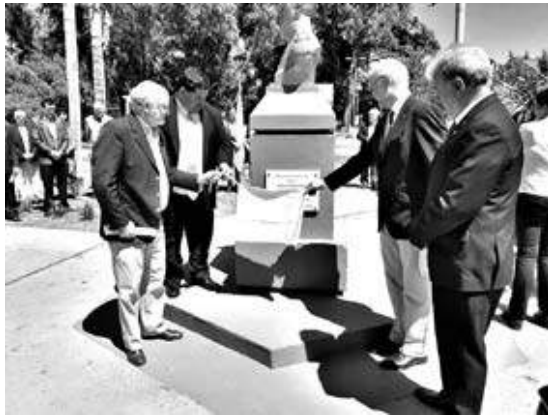
El homenaje al Almirante Guillermo Brown

Nedela citó el preámbulo de la Constitución Argentina, así como antes lo hiciera el párroco con el preámbulo de la Constitución Irlandesa