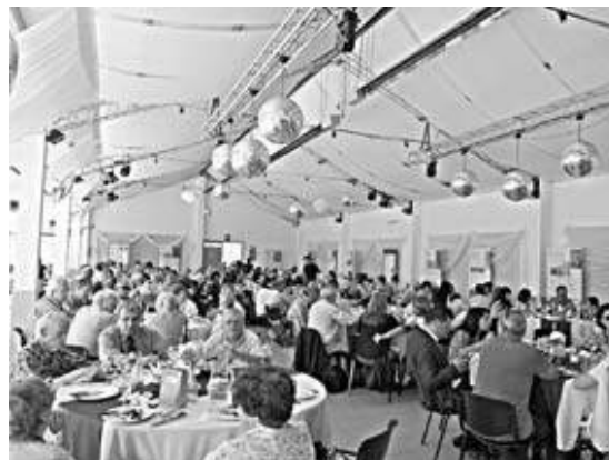
El multitudinario almuerzo en el predio de Costa Manzana

durante la santa misa, para reafirmar el compromiso de la nación con los inmigrantes: “es la esencia de nuestro país abrirles las puertas a todos, bienvenidos a nuestra querida ciudad”. Nedela declaró el evento de “interés municipal” debido a la trascendencia e importancia que tiene para el distrito ser sede del Encuentro.