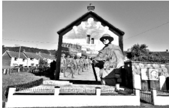
World War One mural, en Newtownabbey