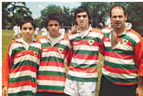
Junto a sus hijos en Hurling