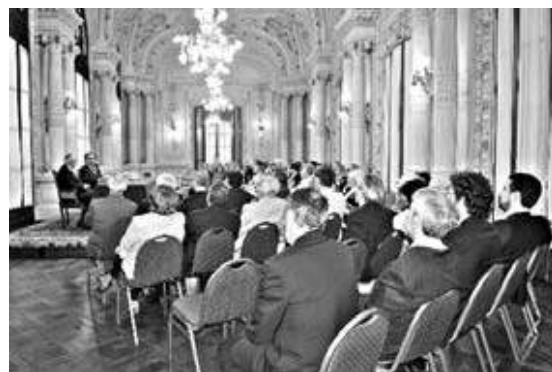
Los asistentes a la sesión pública

El Presidente de la Academia, Embj. Sadous, en su alocución, se refirió a la creciente importancia del ceremonial en diversos aspectos, no sólo en las relaciones entre las naciones.