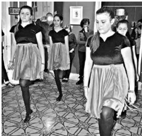
El grupo de Danzas Little Shamrocks

tinuaron durante toda la semana por fuera del día de apertura. Eso nos llena de orgullo. La idea es que se acerquen a vivir una experiencia artística desde las distintas disciplinas y puedan disfrutar de las obras y la cultura Irlandesa. Eso se cumplió y superó nuestras expectativas.