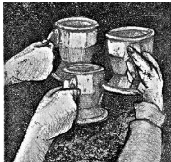
Uno de los cuadros realizados por los artistas

Tenemos las puertas abiertas a todos lo que quieran aportar experiencias y realizaciones afines a la temática irlandesa y celta. Para el próximo año pensamos en armar un ciclo que dure