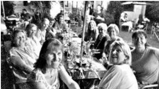
Terminando un año exitoso: la temporada 2016 del Hurling Club Céili Team, Dancing, Dinner & Prize Giving