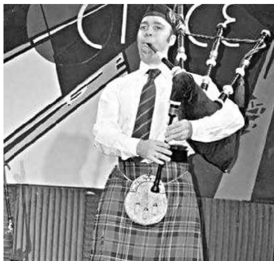
La gaita irlandesa presente en la muestra

La muestra anterior tuvo una gran convocatoria masiva ya que eran vacaciones de invierno. Esta vez el clima no acompañó tanto. Igualmente hubo mucha gente. Y si bien durante la inauguración de esta muestra el público fue menor, las visitas con-