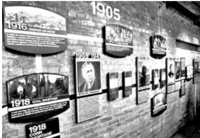
El flamante Museo del Whiskey en Irlanda

La idea inicial parida hace diez años ya cuenta con franquicias en Córdoba, Venado Tuerto, Calafate, La Plata y Rosario, y planes de desembarcar en Salta y en otros países como Uruguay y Paraguay. Whisky Malt Argentina hoy cumple un rol fundamental en el mercado del whiskey argentino. Sus socios son conocedores, curiosos y de buen poder adquisitivo. Así es como las principales empresas delegan en él la distribución de marcas que les cuesta mover en vinotecas o supermercados, como por ejemplo Whyte & Mackay o el codiciado single malt The Dalmore.