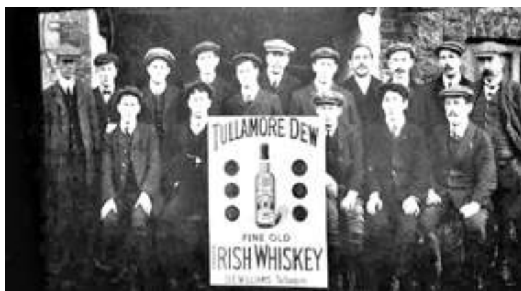
Tullamore Dew, marca emblema

Todo su camino se forjó en Villa Urquiza y también en los Aeropuertos. Su primer contacto con el bendito whiskey comenzó muy temprano, a los 14 años, después de una borrachera importante con amigos. “Mi padre nos habló a todos y se encargó de llamar a los padres de cada uno de ellos. Les contó la verdad y nos citó para la noche siguiente en mi casa. Mi papá tenía la suerte de viajar mucho por el mundo. Le gustaba mucho el Old Parr. Y nos dijo a todos que cuando saliéramos (nunca nos faltaba el dinero para salir, gracias a Dios), buscáramos productos nobles. Prueben cosas como ésta, dijo. Y nos