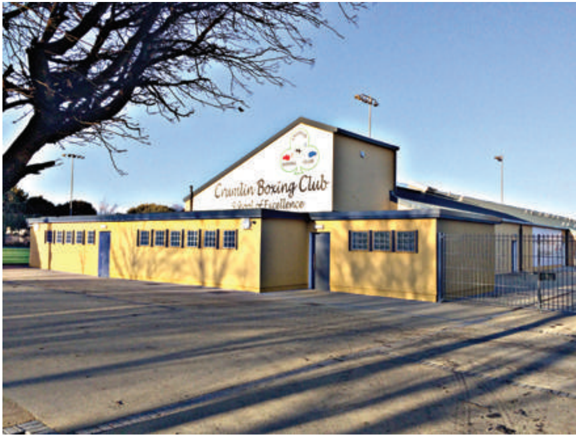
La sede social del Crumlin Boxing Club, en las afueras de Dublín.