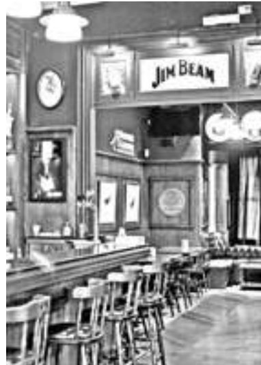
El bar del Museo del Whisky en Buenos Aires