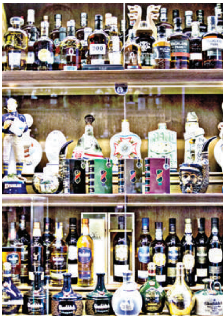
La colección de whiskies más grande del mundo

emparde. “Para mí el whisky es la bebida más noble por su proceso de elaboración, lo que los escoceses e irlandeses cuidan es justamente eso. Respeto mucho más el whiskey escocés e irlandés que el americano. Y me saco el sombrero hoy por hoy por el whisky japonés que fue premiado en los últimos años: ganaron dos años consecutivos al mejor whisky del mundo. Y un dato no menor: ya poseen cinco de las 91 destilerías que tiene Escocia”. El Museo depende a su vez de la Asociación Whisky Malt Argentina, que congrega a 4.000 amantes de este elixir, y donde el 55% del padrón de los socios tiene menos de 30 años. Para asociarse a Whisky Malt Argentina el único requisito es que te tiene que gustar realmente el whisky o whiskey, como gustes llamarlo. Hay que tener placer por el producto y ganas de aprender. Cobran una cuota anual de $ 1.600. Los beneficios son charlas, degustaciones, precios preferenciales en todos las botellas, exclusividad de tener productos que no puede tener nadie. Y la fiesta nacional una vez por año con acceso libre.