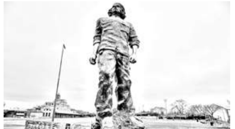
Ernesto (Che) Guevara's monument in Rosario

A liberal think-tank in his home town wants monuments to the revolutionary icon taken down