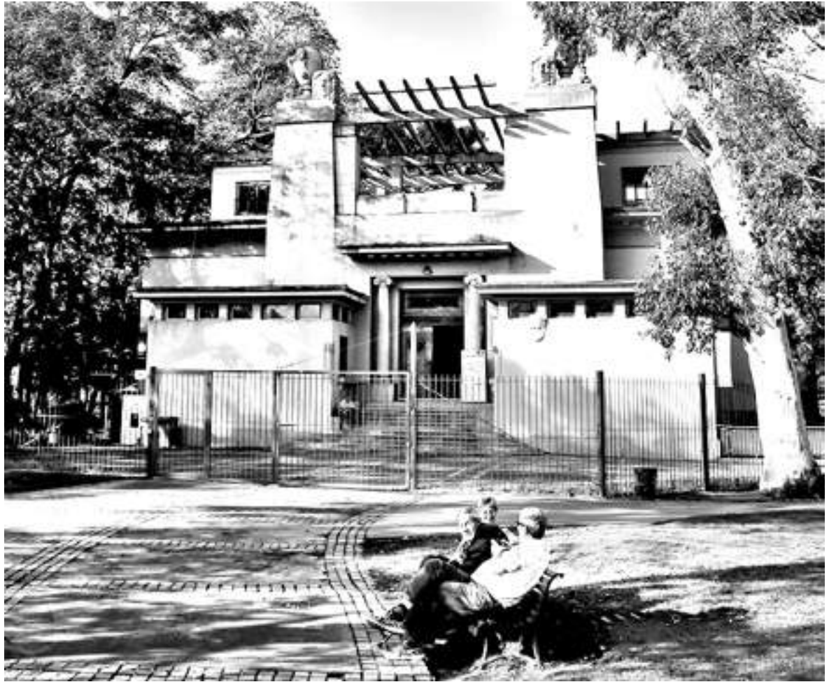
La escuela n° 2 sigue sin nombre

Es la Media N° 2, del distrito escolar 13; en 2010, docentes, padres y alumnos votaron para llamarla Ernesto Guevara