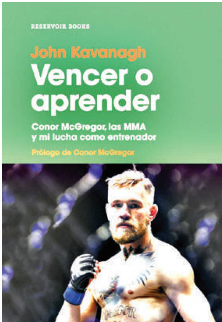
El libro aun no llegó a la Argentina. Solo fue editado en Europa