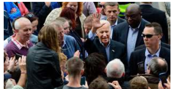
US vice president Joe Biden greets residents at Carligford, Co Louth.