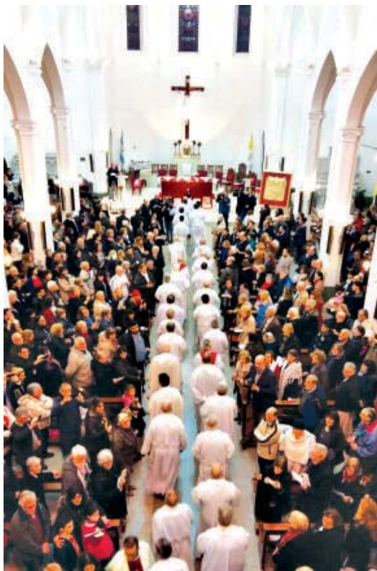
Los sacerdotes entrando a San Patricio

"También las cicatrices de Jesús se vieron en los cuerpos de nuestros hermanos religiosos asesinados