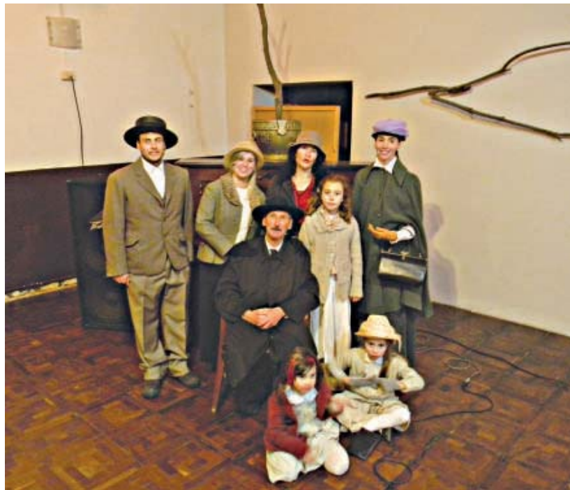
Artistas en escena

La idea de recrear el día más especial en la vida de Leopoldo Bloom que en definitiva significó uno de los días más especiales para la literatura universal al trascender las hojas del Ulises y llegar a la vida real, a las calles reales. La vida misma hecha literatura, trascendental, describiendo lo cotidiano de una sociedad puesta en escena permanente y que sería el germen de las derivas que se viven en la era del Pokemon Go. La mañana del 16 de junio en la plaza principal de Monte, famosa por sus golondrinas y con WiFi, arrancó con el grupo de la comunidad irlandesa local, en medio de un frío bien irlandés y un cartel que anunciaba el "BloomsDay en Monte", leyendo la Invocación a Joyce que escribió el gran Jorge Luis Borges en su épico Elogio de la Sombra de 1969: Dispersos en dispersas capitales, solitarios y muchos, jugábamos a ser el primer Adán que dio nombre a las cosas. Por los vastos declives de la noche que lindan con la aurora, buscamos (lo recuerdo aún) las palabras de la luna, de la muerte, de la mañana y de los otros hábitos del hombre. Fuimos el imagismo, el cu-