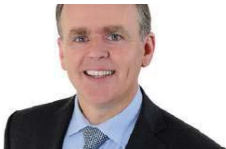
Minister for the Diaspora Joe McHugh.

Fianna Fáil Senator and Spokesperson on Foreign Affairs, Trade and the Diaspora Mark Daly spoke to Newstalk about the possible upcoming referendum. "The most fundamental right of any citizen is the right [to vote] and we must stop denying