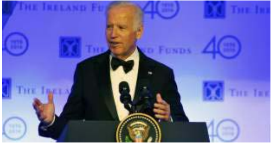
US vice-president speaks at the Ireland Funds 40th celebrations in Trinity College.