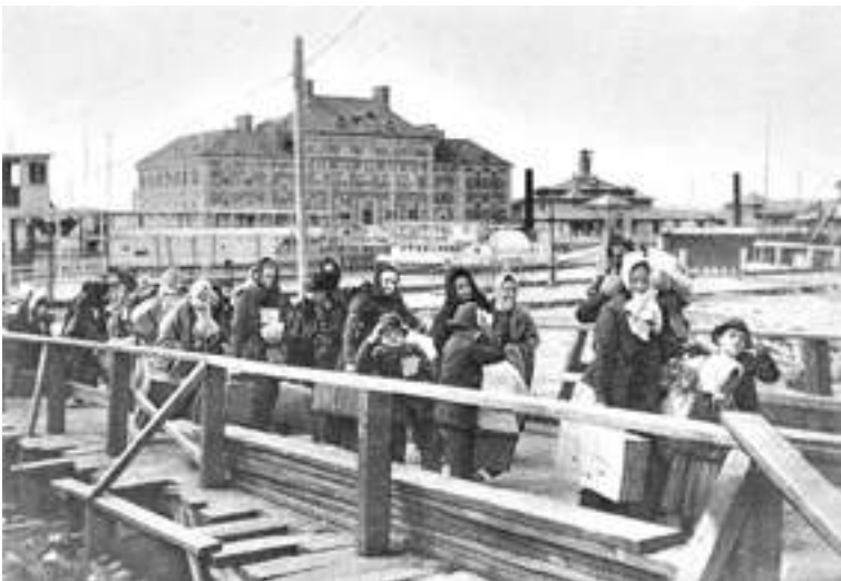
Arrival of immigrants to Buenos Aires port