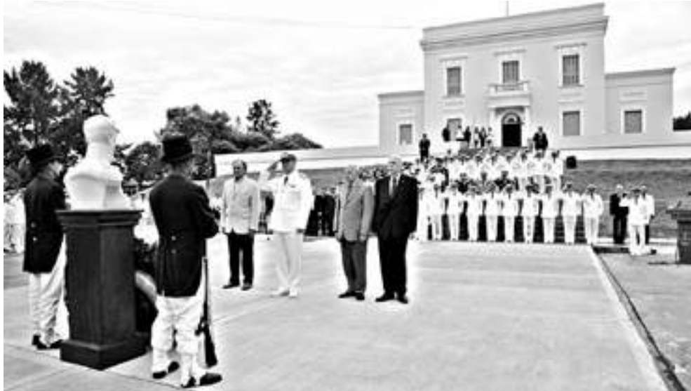
El Alte. Srur y el Secretario Ceballos presidiendo el homenaje