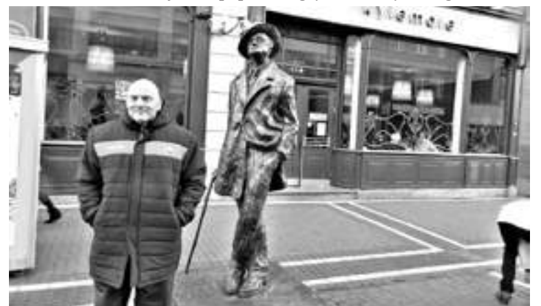
El presidente de Hurling junto a la estatua de Joyce en pleno centro de Dublín, realizada por el escultor Marjorite Fitzgibbon.