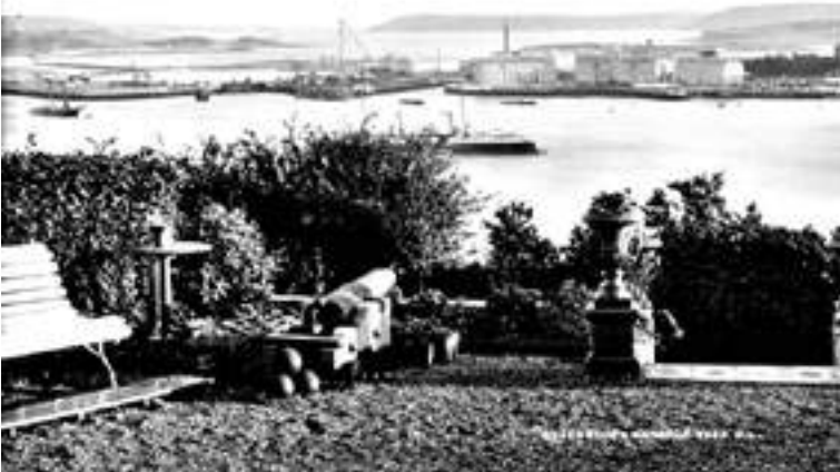
Cobh (Cork) harbour

culture very unlike their own – I am confident if they understood all this they would not be tempted to rush in to such a scheme by the mere attraction of a free passage. Kindly, then, ask the clergy to give them this information, and save the poor people from a foolish step which must lead to disaster.