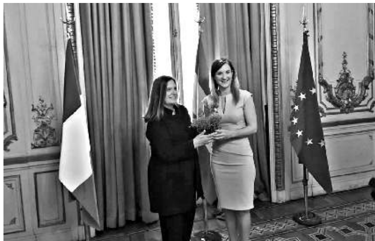
La Ministra McEntee entregó trébol irlandés a la Vicepresidenta Primera de la Legislatura de Buenos Aires en el Día de San Patricio como agradecimiento por el recibimiento que la Ciudad de Buenos Aires le ha dado a los migrantes irlandeses que han llegado a estas tierras.