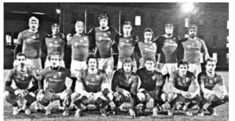
El plantel superior de rugby, después de disputar dos partidos en Irlanda vs Dufc, el equipo de rugby del Trinity College.

Fuimos 86 personas al Tour entre jugadores, dirigentes y algunos acompañantes. Fue un éxito para unir al grupo que se comportó de forma brillante dentro y fuera de la cancha. Nos permitió acercar las raíces al club y acercar el ADN del club a todos los socios."