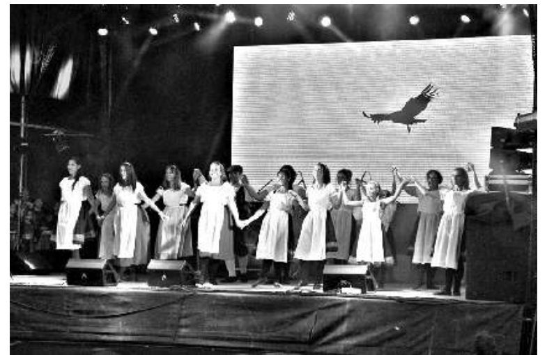
Trevelin Feet en escena