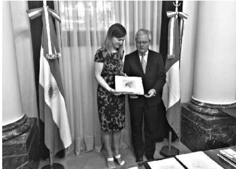
Con el Presidente del Senado, Dr. Federico Pinedo, discutiendo sobre las relaciones bilaterales y las celebraciones de San Patricio en Buenos Aires