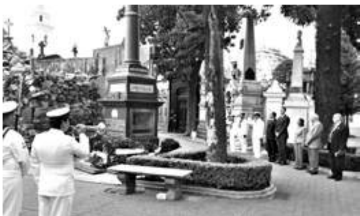
Ante el sepulcro del Alte. Brown