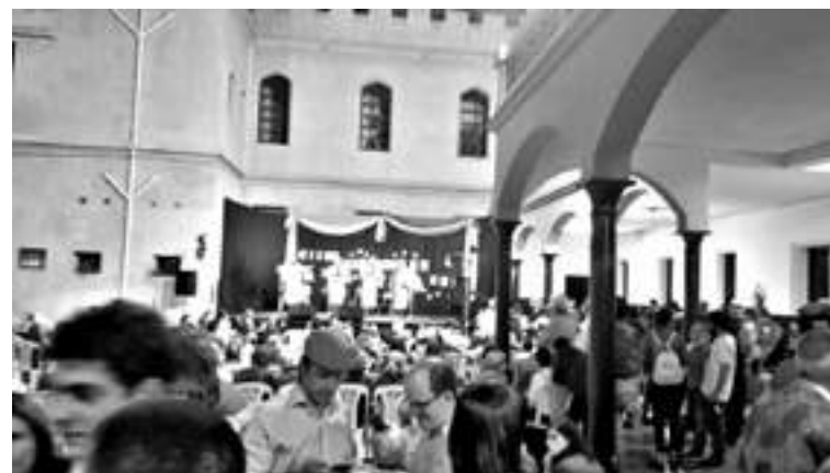
Los Pulperos nuevamente en acción