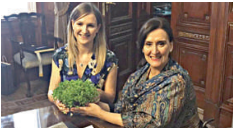
La Ministra McEntee entrega el trébol irlandés a la Vicepresidenta Gabriela Michetti, quien es invitada a visitar oficialmente Irlanda.

La Ministra, a pesar de sus 30 años, tiene una brillante carrera parlamentaria. Nacido en Castletown, Meath, estudió en la Dublin City University y joven abrazó las filas