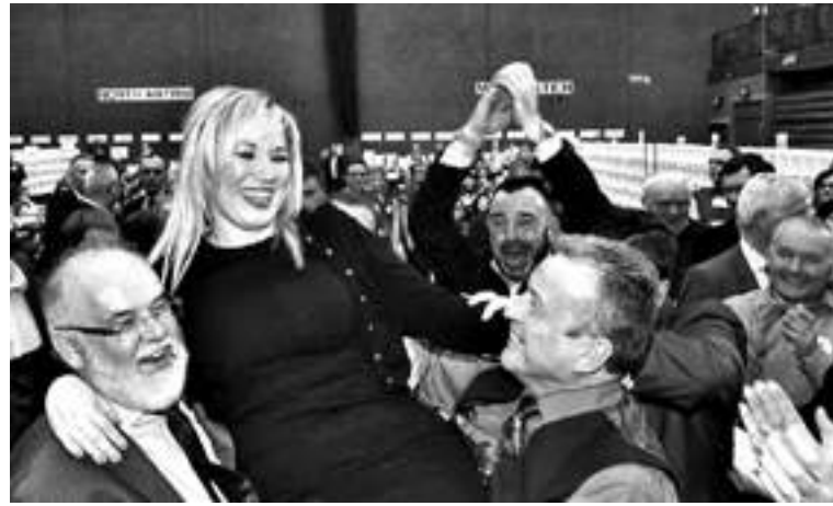
Mary Lou McDonald

La decisión del Sinn Féin de provocar el adelanto electoral ha sido recompensada en las urnas, donde los republicanos han cosechado un resultado histórico. No solo han sido quienes más han crecido (casi 4 puntos, frente