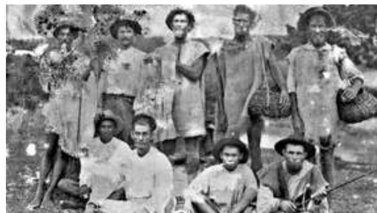
Irish slaves in Barbados