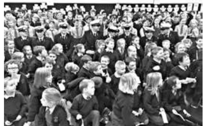
En la Escuela Nacional de Foxford