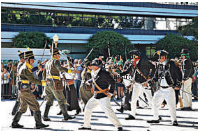
Recreación histórica: criollos contra realistas