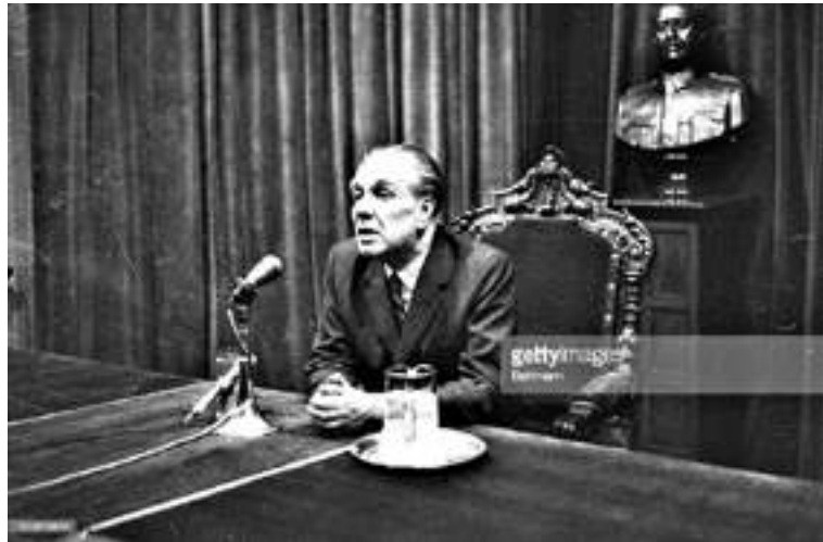
Jorge Luis Borges

la iba a terminar. Ahora pasaron unos cuantos años, estoy muy enganchado y la quiero terminar bien.