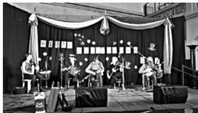
Los músicos en escena