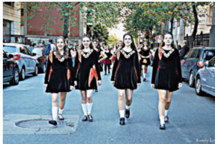
Las chicas de Celtic Argentina en el desfile