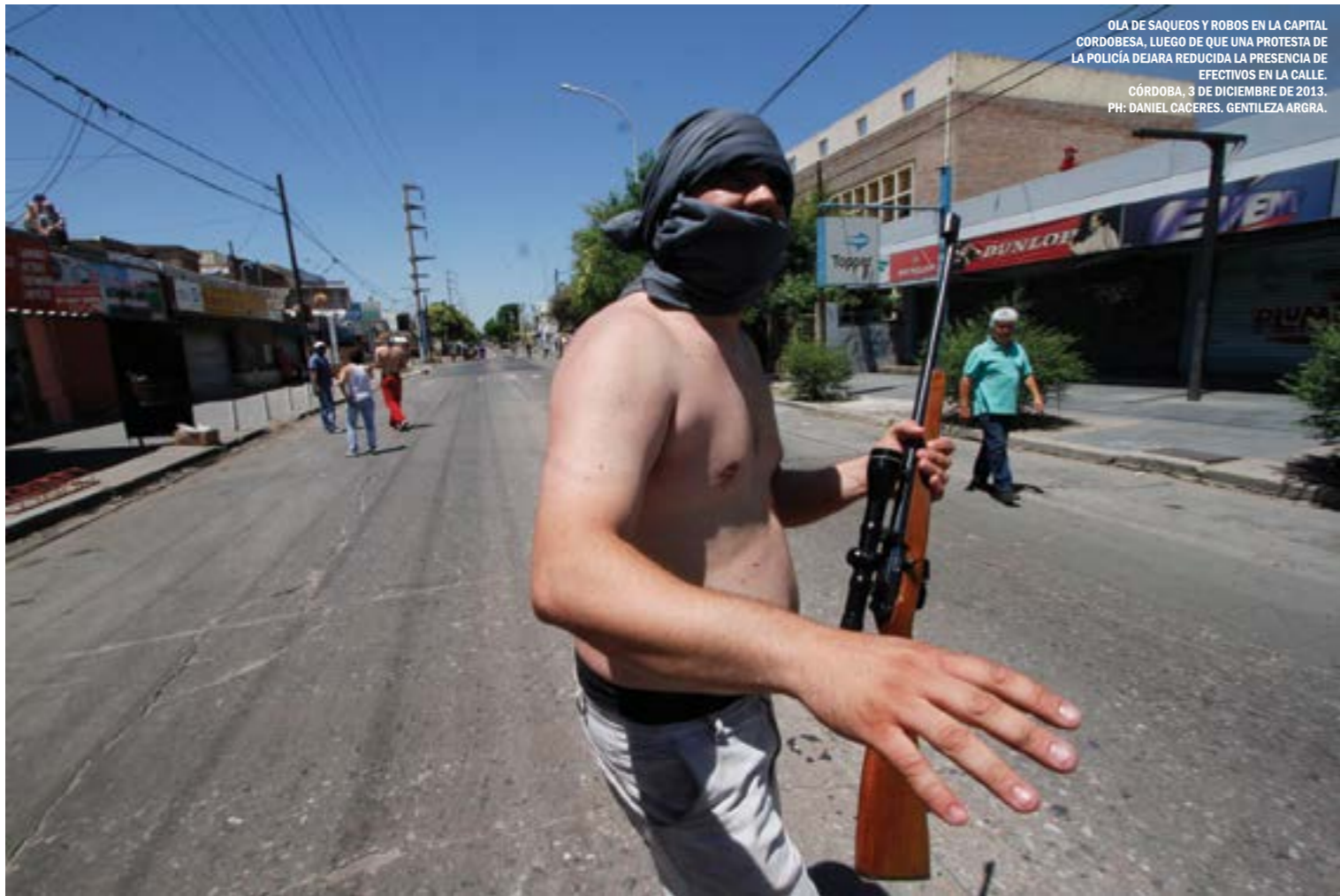
OLA DE SAQUEOS Y ROBOS EN LA CAPITAL CORDOBESA, LUEGO DE QUE UNA PROTESTA DE LA POLICÍA DEJARA REDUCIDA LA PRESENCIA DE EFECTIVOS EN LA CALLE. CÓRDOBA, 3 DE DICIEMBRE DE 2013.