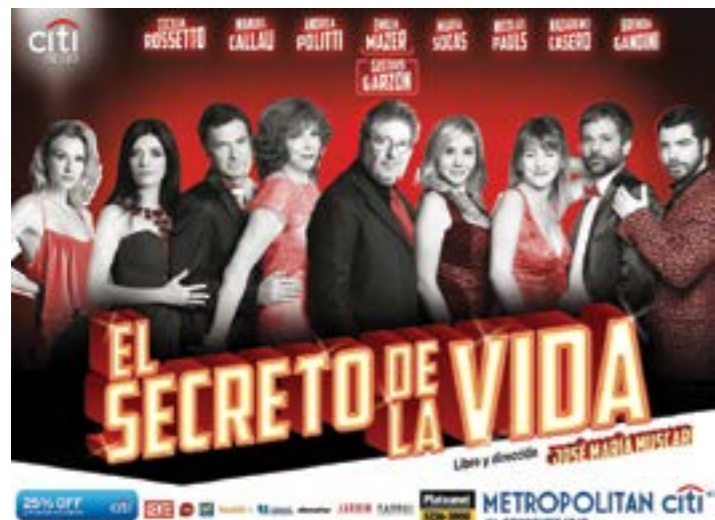
EL SECRETO DE LA VIDA: DE MIÉRCOLES A DOMINGOS EN EL TEATRO METROPOLITAN CITI.

cuando eras muy chico ¿lo considerabas una vocación o empezó como un juego?