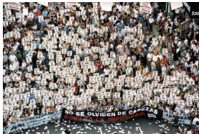
MANIFESTACIÓN A UN MES DEL ASESINATO DEL REPORTERO GRÁFICO JOSÉ LUIS CABEZAS. CIUDAD DE BUENOS AIRES, FEBRERO 1997.