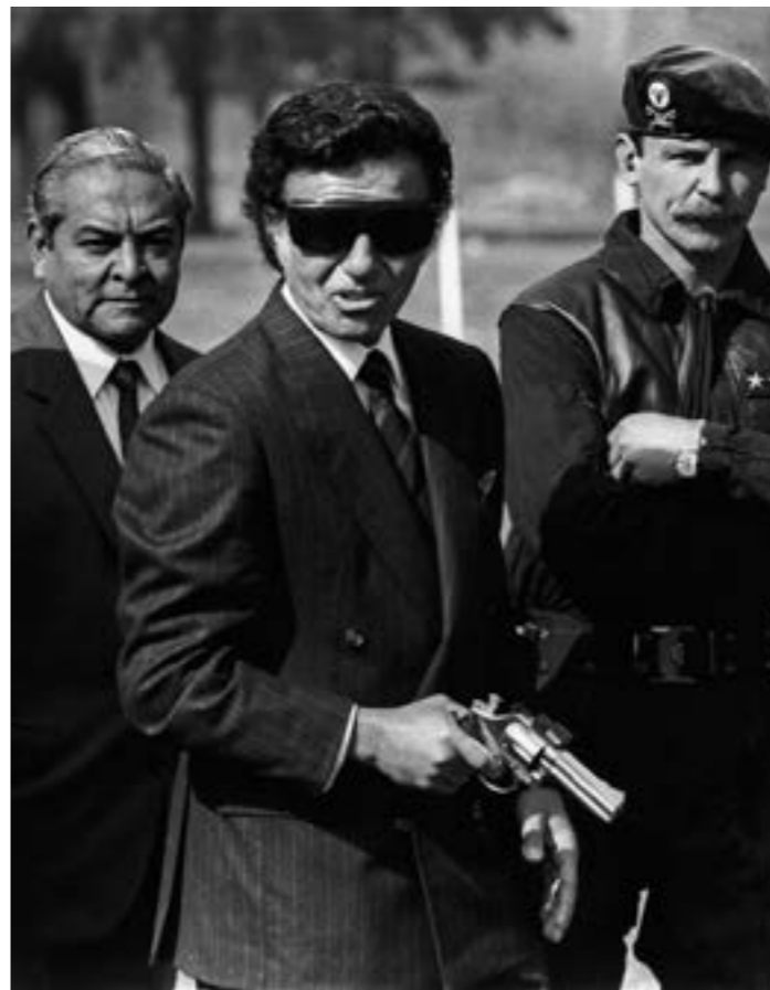
EL PRESIDENTE CARLOS MENEM ARMADO Y CON EL EQUIPAMIENTO DE PROTECCIÓN DE LOS TIRADORES DURANTE UNA PRÁCTICA, JUNTO AL MINISTRO DE DEFENSA ERMAN GONZALEZ. ANIVERSARIO DE LA CREACIÓN DE LA ESCUELA DE SUBOFICIALES DE LA GENDARMERÍA. BUENOS AIRES, ARGENTINA 1994.