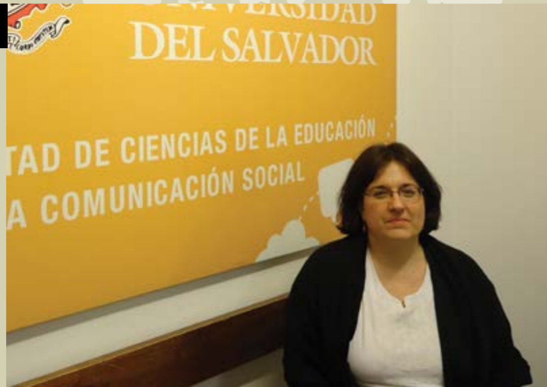
"EN MI CASA DINERO NO HABRÁ, PERO LIBROS HAY".

En general sigo más autores, voy haciendo una cadena, si estoy leyendo a Borges y él habla de Poe me voy a Poe, de ahí voy a quien Poe menciona. A lo mejor de un autor inicial parto a otros autores, es como un recorrido amistoso porque