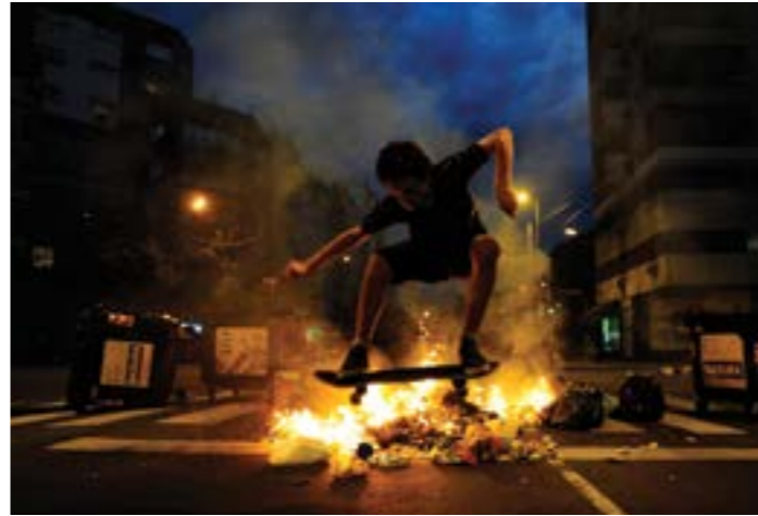
VECINOS DEL BARRIO PORTEÑO DE BARRACAS CORTAN AVENIDAS EN PROTESTA POR LOS SUCESIVOS CORTES DE LUZ EN LA ZONA. BUENOS AIRES, 26 DE DICIEMBRE DE 2013.