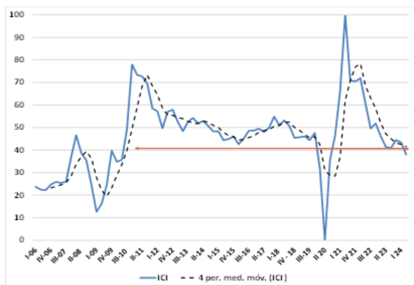
Gráfico 2. Índice de Condiciones Internacionales (ICI USAL) I.2006 – II.2024